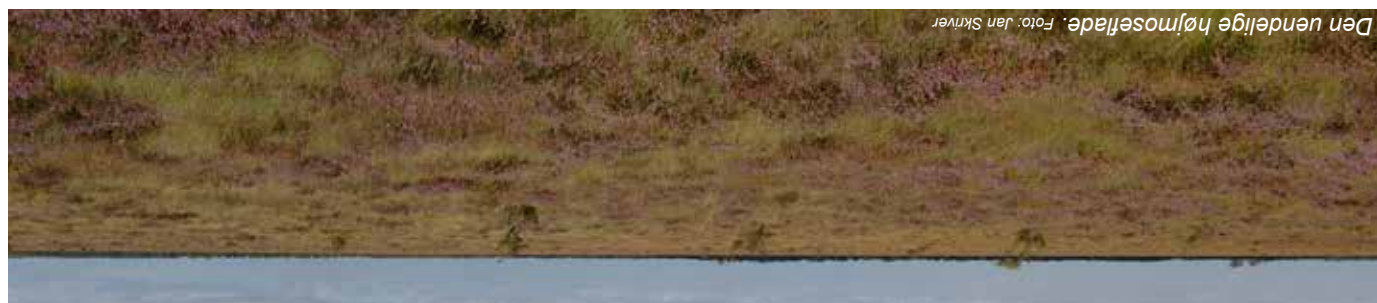
Den vendelige højmosesfæde.

Tofte Mose er på ca. 2000 ha, og er den sydlige rest af den oprindelige højmosse, der sandsynligvis var på omkr. 6000 ha i 1700-tallet. Højmosen er dannet gennem mere end tusind år af tørvemosse, hvis latinske navn er sphagnum. En højmosse får kun vand via nedbør, der er næringstætigt. Fga. tørvemossets evne til at binde vand og "vokse oven på sig selv", hvælver højmosen sig over det omgivende terræn, deraf navnet.