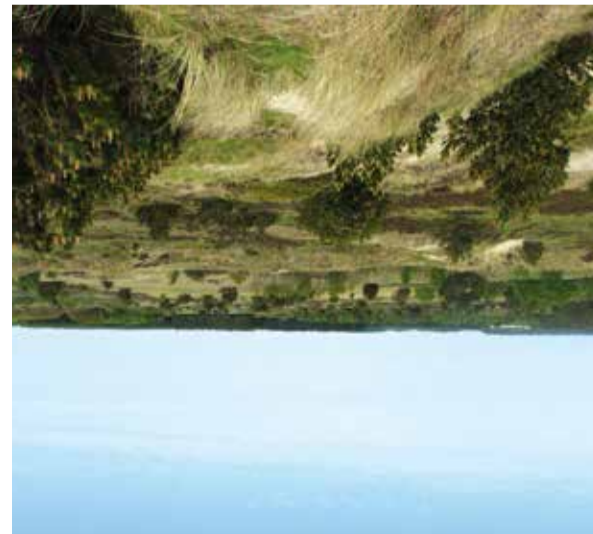
Indlandsklitter i Sandmosen

Store dele af landskabet er præget af den sandflugt, der satte ind fra 1500-tallet langs hele kysten. I Sandmosen findes et stort område med indlandsklitflugt, der fortæller historien om, hvordan sandet nåede langt ind i land. For at stoppe sandflugten begyndte stænen fra slutningen af 1800-tallet at opkøbe og tilplante store områder langs kysten.