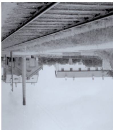
Briketfabrikken blev opført i 1925

Briketfabrikken var den første af sin art ikke alene i Danmark, men i verden. Og der kom folk fra forskellige verdensdele for at lære, hvordan man fremskillede briketter, hvordan man stænen fra slutningen af 1800-tallet at opkøbe og langt ind i land. For at stoppe sandflugten begyndte ter, der fortæller historien om, hvordan sandet nåede Sandmosen findes et stort område med indlandsklitflugt, der satte ind fra 1500-tallet langs hele kysten. I Store dele af landskabet er præget af den sand-