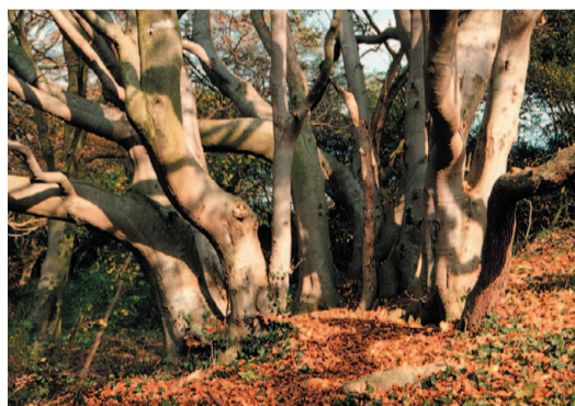
Den særprægede moræneknold "Jernhatten"

Forløbet gennem "bjergene" ender ved Rugård Sønderkov, hvor Nordsøstien går ned over kystskrænterne og forbi Rugård Strand Camping. Man kan dog også vælge en alternativ rute forbi herregården Rugård . Hovedbygningen stammer fra 1500-tallet, og godset er omgivet af et typisk herregårdslandskab, hvor især de mange flotte