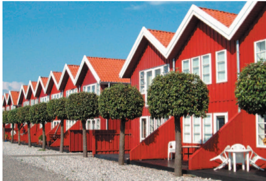
På vej gennem lystbådehavnen i Ebeltoft kommer man forbi de røde "skagenshuse", som er blevet et populært islet i mange danske lystbådehavne.

Ebeltoft er en gammel købstad, som udviklingen mere eller mindre gik uden om i 1800-tallet. Derfor er en stor del af den gamle bykerne bevaret omkring gaderne Adelgade , Overgade og Nedergade . Torvet foran rådhuset fra 1789 er særlig stemningsfuldt ikke mindst en sommeraften, hvor de gamle vægtersange bliver sunget hér.