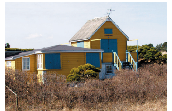
Et af de små charmerende sommerhuse på Grenaa Strand.