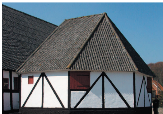
Herregården Rugård kan bl.a. fremvise denne velbevarede hesterundgang.

Forløbet gennem "bjergene" ender ved Rugård Sønderkov, hvor Nordsøstien går ned over kystskrænterne og forbi Rugård Strand Camping. Man kan dog også vælge en alternativ rute forbi herregården Rugård . Hovedbygningen stammer fra 1500-tallet, og godset er omgivet af et typisk herregårdslandskab, hvor især de mange flotte