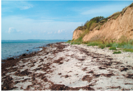
Kysten ud for Ahl Hage

Umiddelbart efter Ebeltoft Færgenhavn går Nordsøstien fra hovedvej 21 og ud langs kysten mod Ahl Plantage . Her ligger et større sommerhusområde og flere gamle feriekolonier . I Ahl Plantage følger Nordsøstien en eksisterende (gult afmærket) sti gennem et skovområde, som til tider kan være noget sumpet.